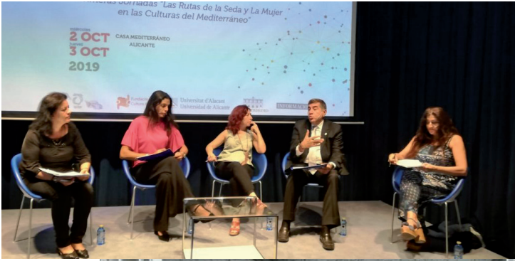
Distintos momentos de las jornadas del 2 y 3 de octubre